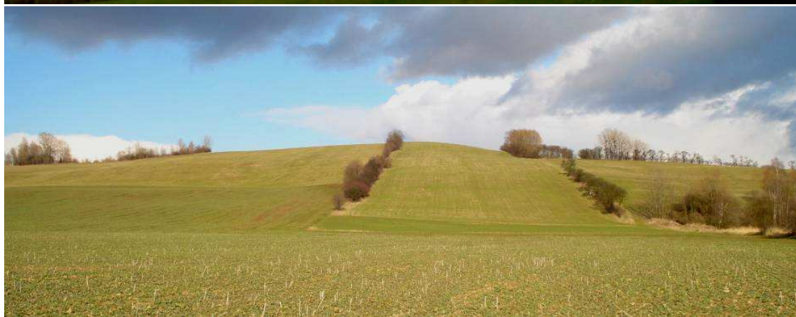
POHLED OD ZÁPADU