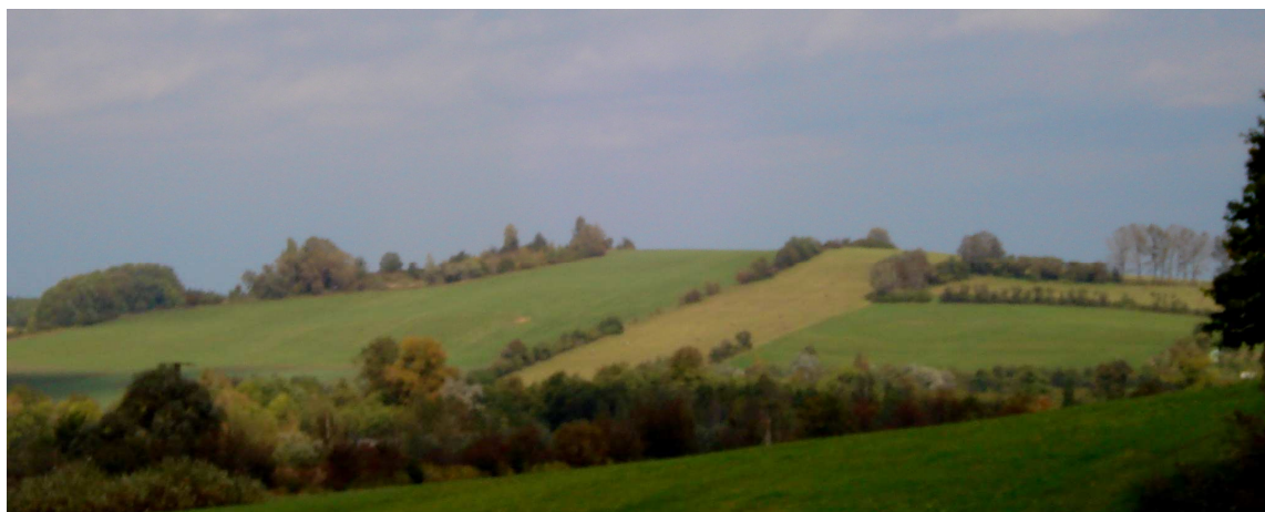
POHLED OD JZ