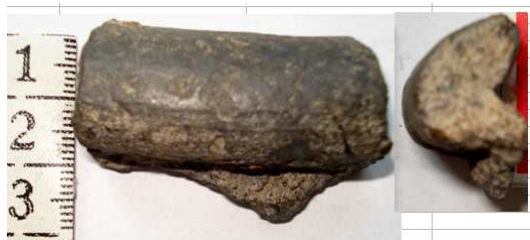
Keramický zlomek hrdla nádoby

Dobou laténskou začíná ve střední Evropě raná doba dějinná (protohistorická). Keltové, obyvatelstvo indoevropského původu, jsou nejstarším historicky doloženým etnikem severně od Alp. Keltové nebyli jenom obávanými bojovníky, ale měli nemalé řemeslnické a technické schopnosti i velké umělecké nadání. Zakládali oppida, což byla opevněná rozsáhlá sídliště na ploše několika desítek hektarů, s několika sty až tisíci obyvateli. Oppida byla především výrobními středisky, středisky bohatství a moci politické i vojenské. Archeologické nálezy vypovídají o činnosti kovářů, slévačů bronzu, výrobců šperků z drahých kovů, bronzu, o dovednosti hrnčírů, jejichž běžnou výbavou se stal otáčivý hrnčířský kruh. Keltové razili zlaté a stříbrné mince. Laténské (keltské) osídlení se v okrese Nový Jičín projevuje poměrně pozdě, až někdy okolo poloviny 2. stol. př. n. l. a přetrvává zde až do století následujícího. Nejlépe prozkoumaným sídlištěm je prozatím „Šutyrova studánka“ u Kopřivnice, můžeme je datovat do 2. pol. 2. stol. př. n. l. až do 1. stol. př. n. l. Ještě četnější a hlavně rozmanitější nálezy pocházejí z Kotouče, jsou dokladem osady, počínající však o něco později, v 1. pol. 1. stol.