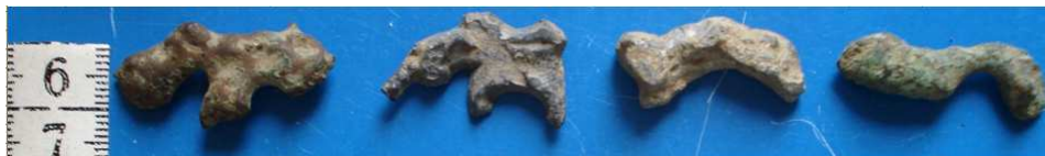
Zoomorfní bronzové plastiky

Další stopy laténského osídlení pocházejí přímo z Kopřivnice, jde o zlomky keramiky získané v samotném městě, mezi rameny Kopřivničky. V blízkém okolí Příbora byly zatím zaznamenány z této doby jen ojedinělé nálezy z lokality Bažantnice (viz. zlomek hrdla nádoby a zoomorfní bronzové plastiky).